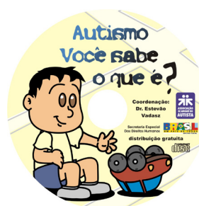
CD - Autismo, você sabe o que é?